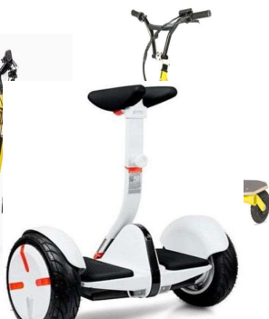
Patinete eléctrico con sillín